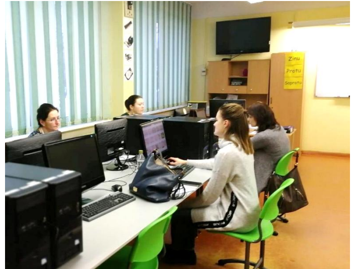
1. un 2. att. Rīgas Klasiskā ģimnāzijas skolotāji kursu "IT prasmes mācību materiālu izstrādei" nodarbību laikā